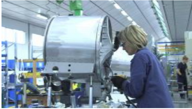
Girbau, de taller electromecánico a producción industrializada